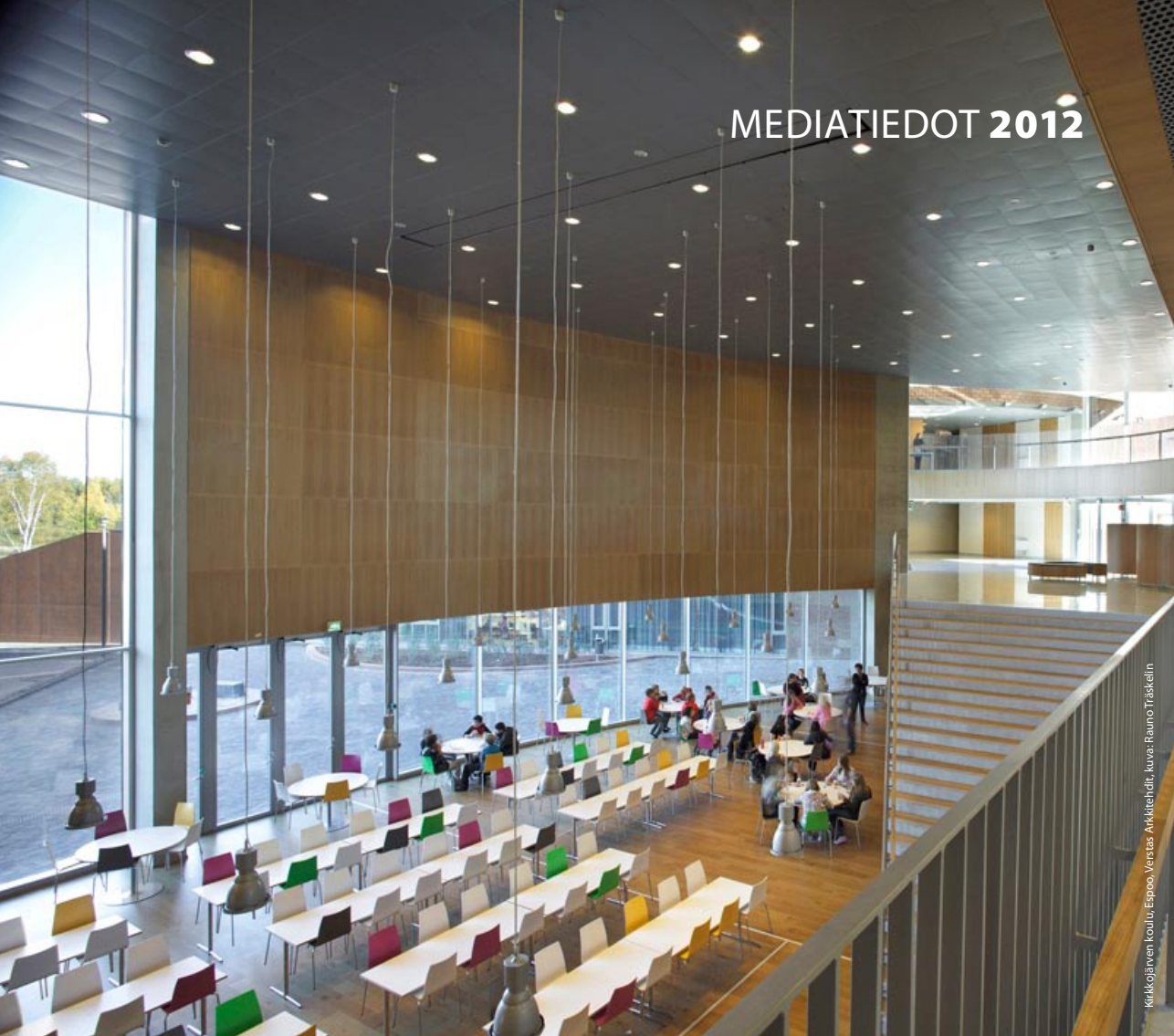
Kirkkojärven koulu, Espoo, Versas Arkkitehdit